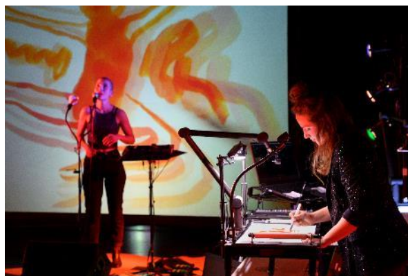
Hep ! Hep ! Hep ! (karaoké dessiné)