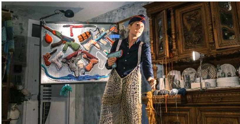
Parler la Poudre