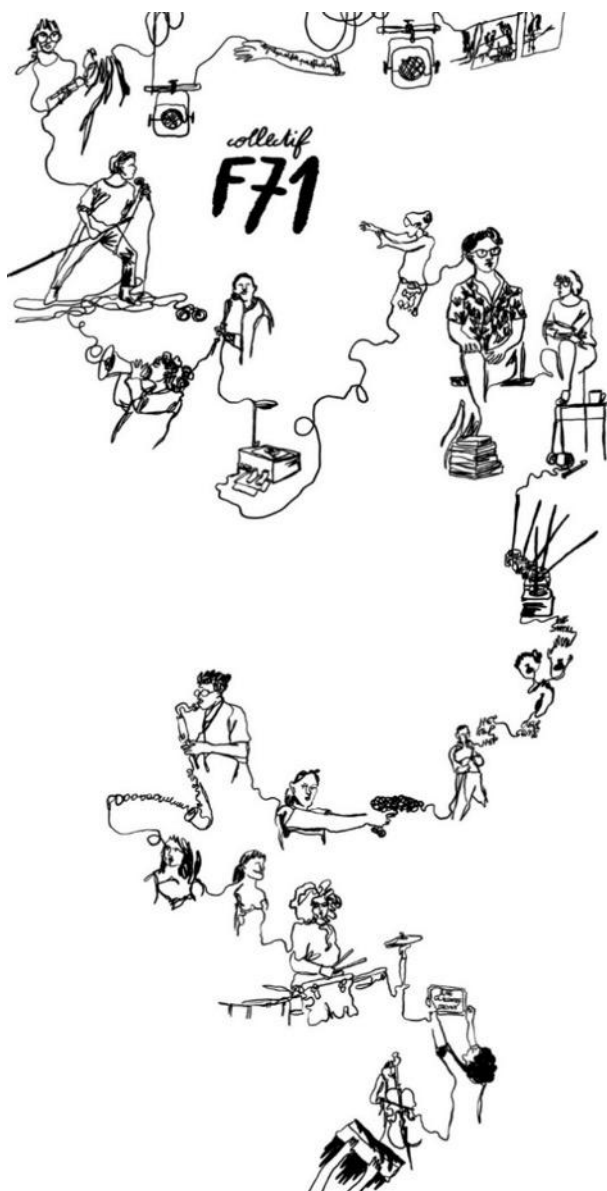
Dessin : Charlotte Melly

Le travail du Collectif F71 se caractérise par l'interrogation du réel et de l'Histoire contemporaine, par l'usage de matériaux dramaturgiques diversifiés, pour construire une écriture scénique (archives, textes littéraires, articles, dessins, paroles, matériaux du réel non-théâtraux). Le collectif F71 s'est d'abord appuyé sur l'œuvre du philosophe Michel Foucault pour construire une première série de spectacles. Depuis, nous travaillons à faire du théâtre à partir de cette « exaspération de notre sensibilité de tous les jours » que nous y avons puisée. L'expérience collective de nos précédents spectacles et de notre mode de création constitue aujourd'hui le socle de notre identité esthétique et dramaturgique.