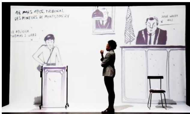
Noire, roman graphique théâtral