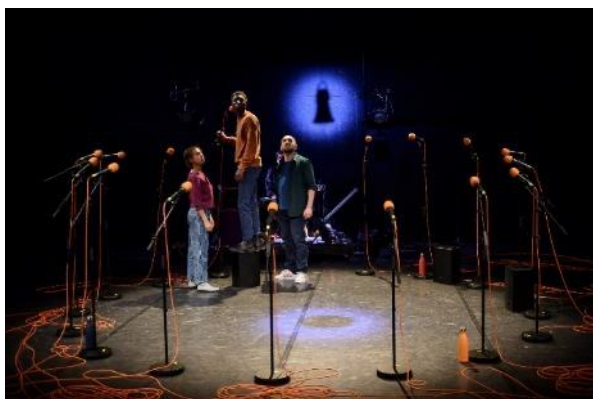
Le Dernier Voyage (AQUARIUS)