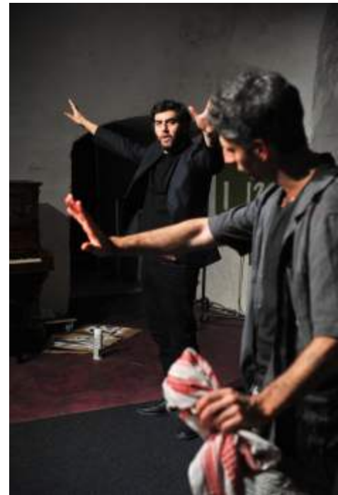
A HANDBOOK FOR THE ISRAELI THEATRE DIRECTOR IN EUROPE