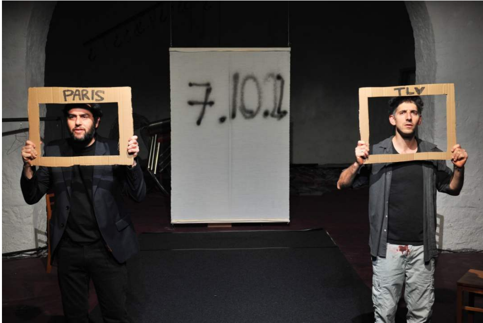
A HANDBOOK FOR THE ISRAELI THEATRE DIRECTOR IN EUROPE