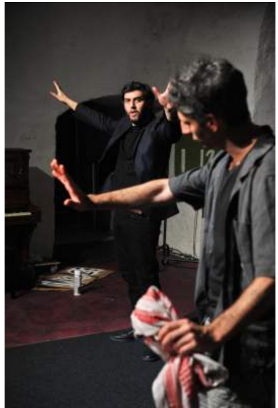
A HANDBOOK FOR THE ISRAELI THEATRE DIRECTOR IN EUROPE