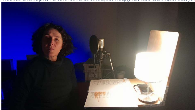
Estelle Aubriot, actrice, Bitche, mars 2023.