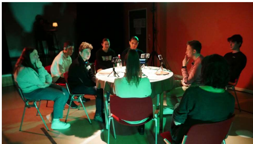
Laboratoire au Lycée de Bitche : test à 12 joueurs, mars 2023.