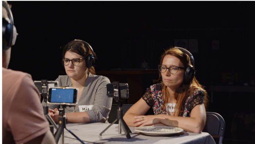
Tests Arbre de Mia, B2S, juin 2022.

Scène 3 : flashforward : 2026 : Mia est devenue mère d'un petit garçon, Olivier. Depuis qu'elle a appris le secret de sa naissance, Mia a rompu avec sa famille. Ceux-ci n'ont de cesse de rencontrer leur petit-fils Olivier. Mia sert le petit déjeuner à son fils et tente de lui raconter son origine et celle de son nom.