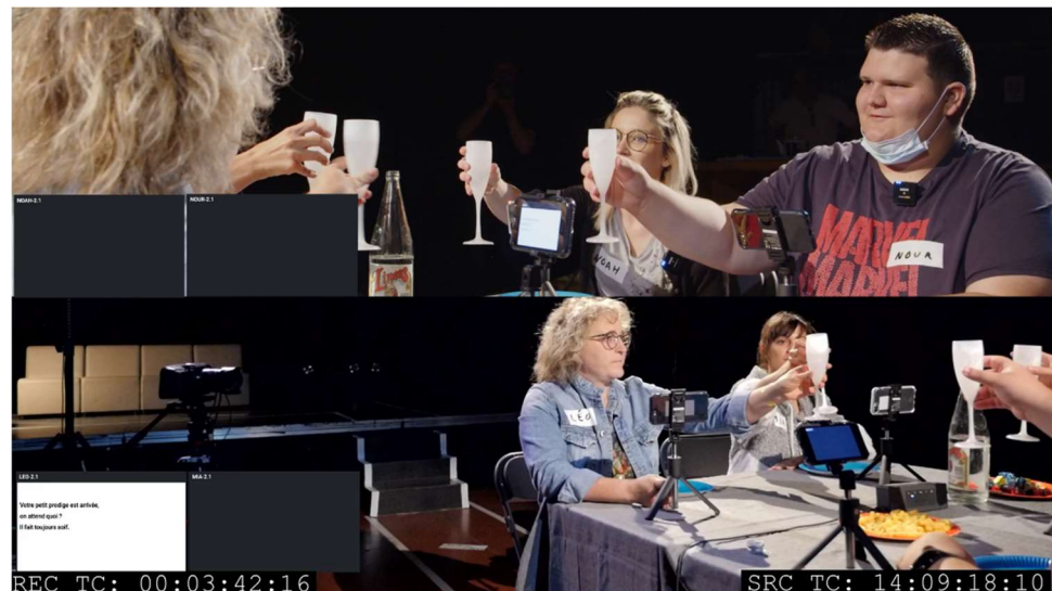
Tests de L'Arbre de Mia , B2S, juin 2022.

Pour préparer l'expérience, nous proposons en amont un atelier pratique de lecture de texte à voix haute, en direction du public jeune. L'occasion d'aborder quelques clés techniques sur la voix portée, l'adresse.